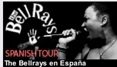
Spanish Tour The Bellrays en España