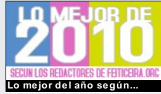
Lo mejor del año según...