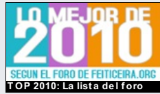
TOP 2010: La lista del foro