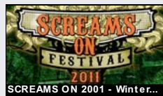
SCREAMS ON 2011 - Winter...