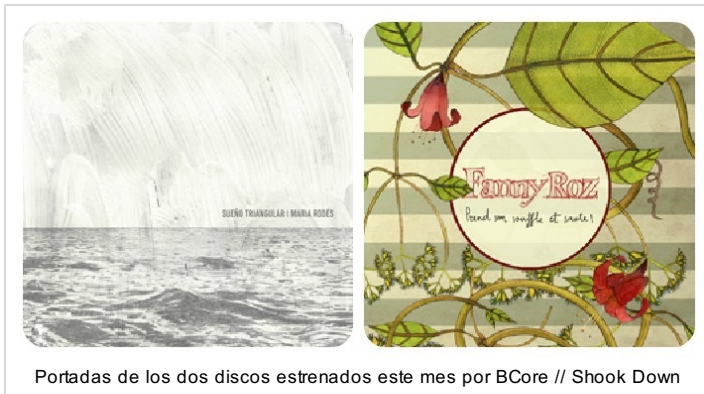
Portadas de los dos discos estrenados este mes por BCore // Shook Down