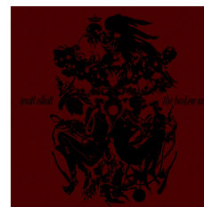
MATT ELLIOT THE BROKEN MAN

Tras recuperar en 2010 su antiguo proyecto Third Eye Foundation con el notable, oscuro y electrónico The dark , Matt Elliott prosigue su prolífica carrera en solitario publicando The broken man . Masterizado por su amigo Yann Tiersen (Elliott cantaba también en algunos temas del último disco del galo), el álbum se vertebra alrededor de las guitarras españolas construyendo momentos íntimos e intensos, pero también muy amargos. Melodías casi desnudas acompañan la voz descarnada de este «hombre solitario» que una vez más consigue dejarnos con el corazón en un puño.