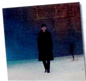
James Blake Overgrown / ATLAS

Han passat tres anys, han deixat pel camí la vessant més lúdica i la pinzellada electrònica. Els de Gurb abracen un so més cru, més hard-core, més anys noranta. Aquí no hi ha pop, ni melodies, són pastilles sense embolcall, denses i accelerades de guitarres amb mala llet, fent-nos sentir la fredor i la solitud de les granges i les fàbriques porcines de la Plana de Vic un dia gelat del mes de gener. /// SERGI COMA