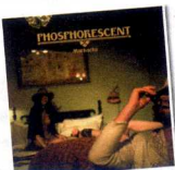
Phosphorescent Muchacho / Dead Oceans

El quartet català sona tan segur com sempre en el seu tercer assalt llarg. Fins i tot, s'aventura amb èxit a aixecar les cançons sense arranjaments de cordes i vents i, definitivament, sense el carismàtic ukelele -instrument que va ajudar a identificar el seu so. De nou, el grup apropa una corda d'inspirades cançons, on la inventiva i la capacitat d'observació sobresurten amb indubtable encant. /// DIMAS RODRIGUEZ