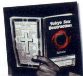
Tokyo Sex Destruction Sagittarius / BCore