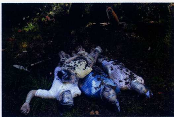
F. LAS COLECCIONISTAS